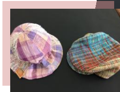
携帯入れ、ポシェット、ペンケース、ポーチ 1,200 円 帽子 3,800 円 バッグ 4,000 円～など