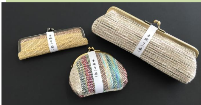
印鑑ケース 800 円、ペンケース 1,500 円、財布 800 円