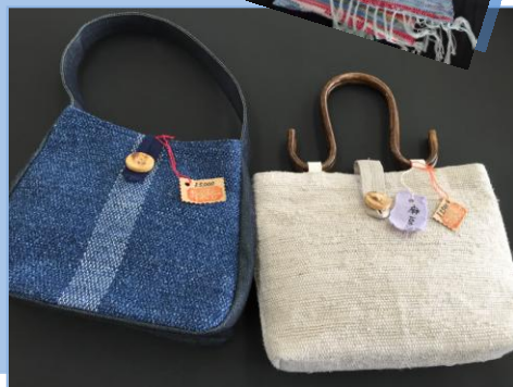
コースター 250 円 バッグ 4,000 円～など

横糸に裂いた布を使う織物です。 着物や浴衣、麻布を裂いて、織り込んでいきます。 糸を使った織り物とは一味違う風合いがあります。