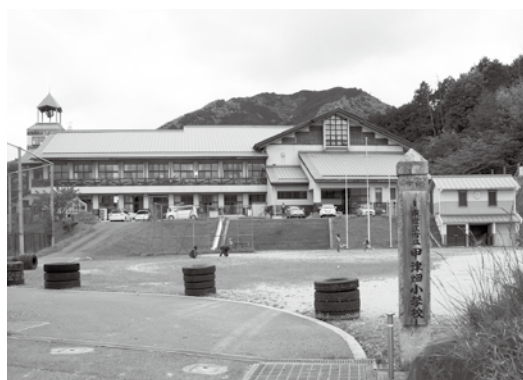
平成23年3月31日で閉校の決まった甲津畑小学校