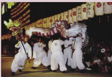
▲②「萬燈祭フィナーレ」