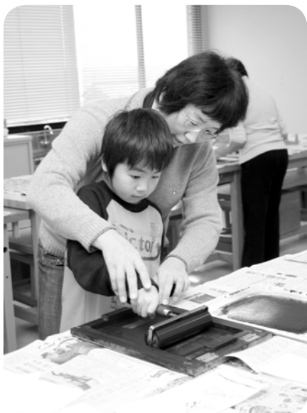
ロウ原紙と年賀状を謄写版にセットし、ローラーで押さえて印刷しました。