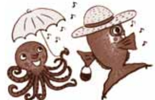
イラスト:せとうちたいこさん「わらべうたうたいたい」(童心社)より