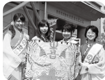
▲八日市大凧まつりでは、レインボー大使(右の2人)も加わった4人が、風の女神として活躍します。