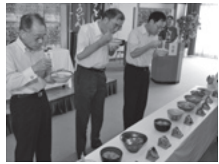
▲8月25日(木)には出店されるうどんが紹介されました。ずらりと並んだうどんは、どれも個性豊か。