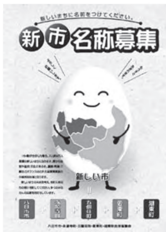
新市名称募集チラシ