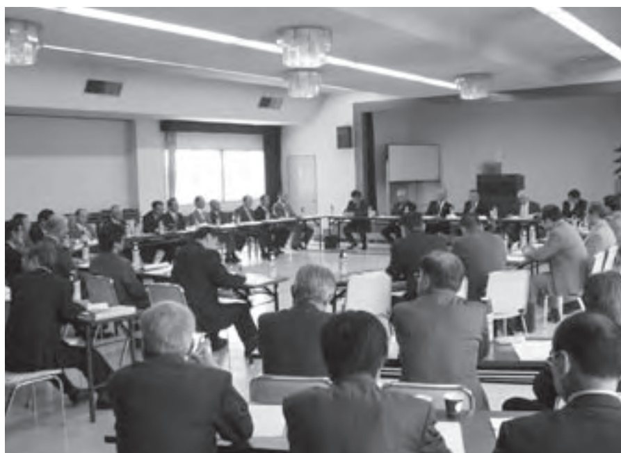
首長・議会代表合同会議