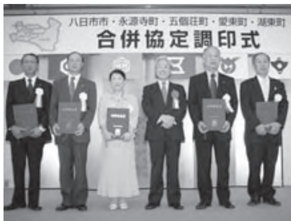
合併協定調印後知事とともに