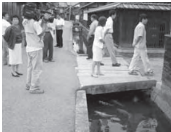
タウンウォッチング(五個荘)