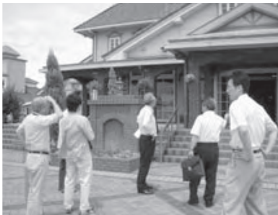
タウンウォッチング（愛東）