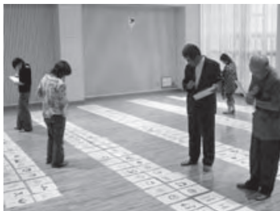
市章デザイン選考委員会