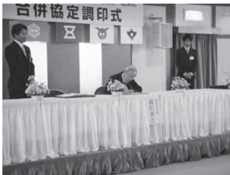
合併協定調印式知事署名