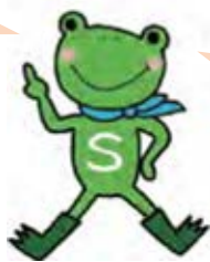
イラスト タカノ キョウコ