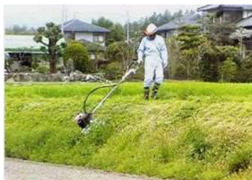
【ハンドガイド式草刈機】