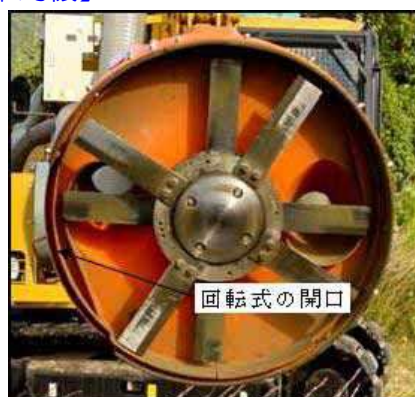
【トラクター装着草刈機】