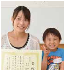
湖東保健 19日(木)、ルを6月コンクールのよい歯の親子のおうと、