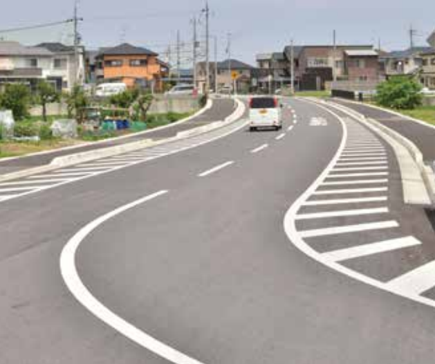
▲平成25年度整備の能登川北部線。長勝寺町方面に延長する計画となっています。