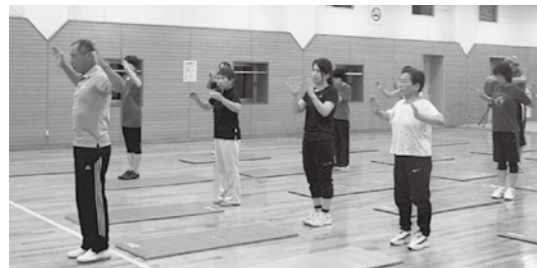
▲健康づくり運動教室の様子