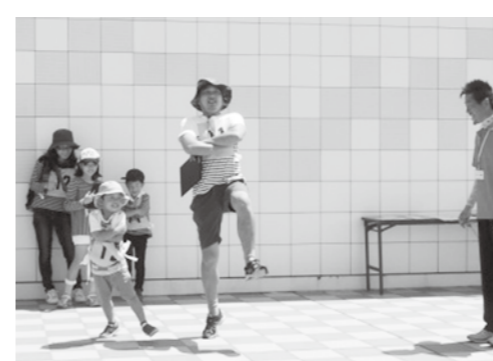
コサックダンスだ立ったままリズムを刻もう!

今、話題の「ゆるスポーツ」を知っていますか? 運動が苦手な人でも年齢を問わず誰もがゆるく楽しめるスポーツ、それが「ゆるスポーツ」です。そんな「ゆるスポーツ」のひとつが「スポーツかるた」。 ルールは簡単! 読み手が読んだ札を探して取りに行き、札に書かれたお題にチャレンジ! 見事成功すれば札がゲットできます。 「コサックダンスだ立ったままリズムを刻もう」、「ゆっくりゆっくり遅いが勝ちの100cm走など44枚44種類のユニークなお題があります。 やっている人はとっても楽しい、見ている人は思わずやってみたくなるスポーツかるた。たまにはゆるくスポーツをしてみるのはいかがですか?