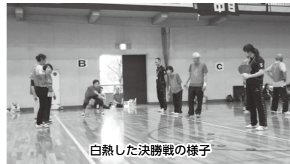
白熱した決勝戦の様子

特に決勝戦では、予選リーグ、決勝トーナメントともに全勝で勝ち上がったチーム同士の対決。結果としては、「五個荘A」が見事な逆転劇で「夢クラブ2」に勝利し、優勝を勝ち取りました。 優勝した「五個荘A」の皆さんは、「平素の実力が発揮できました。優勝できたのは、くじ運がよかったものもありますが、互角の戦いの中で、チームワークが優ったのも勝因のひとつだと思います。」と興奮気味に話していました。 本日に素晴らしいチームワークでした。