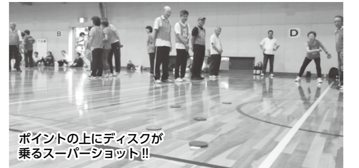
ポイントの上にディスクが乗るスーパーショット!!

ディスコンは、ディスコンをするのが初めての方から毎週サークル活動で取り組んでいる超ベテランの方までが一緒になって楽しめる競技です。そのため、当日の試合中はあらゆるコートから幾度となく拍手と大歓声が響き渡り、大変盛り上がりを見せました。中には、緊迫した試合も多く見られ、1点差で勝敗が決したり、サドンデスまでもつれこむ試合があったりと、参加チームのレベルが年々上がってきているように感じました。