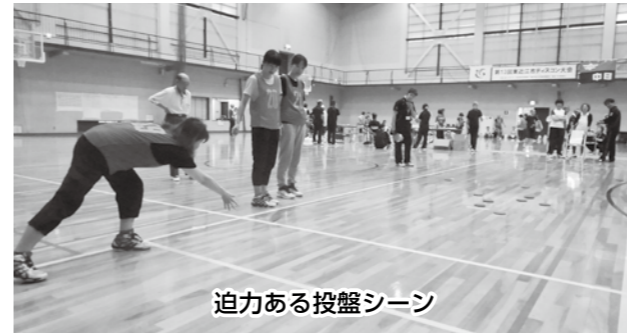
迫力ある投盤シーン

令和最初の本大会は、総勢25チームで争われました。今回で13回目を迎える本大会には、毎回のように出場していただいている方がおられる一方で、初出場の方も多数おられました。大会の回を重ねるにつれてディスコンが普及されていることを実感することができ、私たちスポーツ推進委員としてもこの大会を運営する意義を感じることができました。