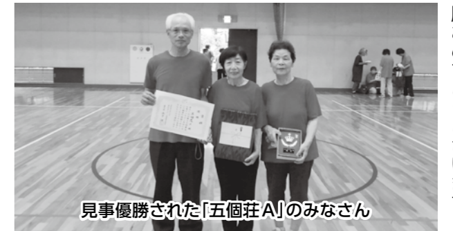
見事優勝された「五個荘A」のみなさん

左図は、本大会の決勝トーナメントの結果です。来年も開催しますので、皆さんの参加を東近江市スポーツ推進委員一同、心よりお待ちしております。