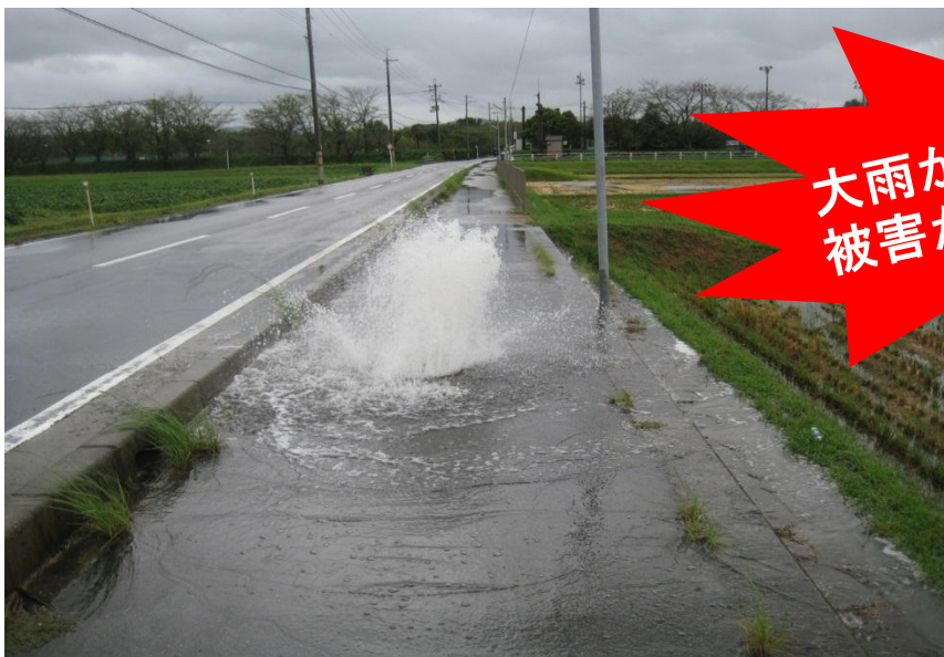
マンホールから汚水があふれ出る様子

雨水を流す雨樋などの排水設備が、誤って「下水管」につながれていることや、排水設備の破損、汚水ますのフタを故意に開けられたこと等が原因です。