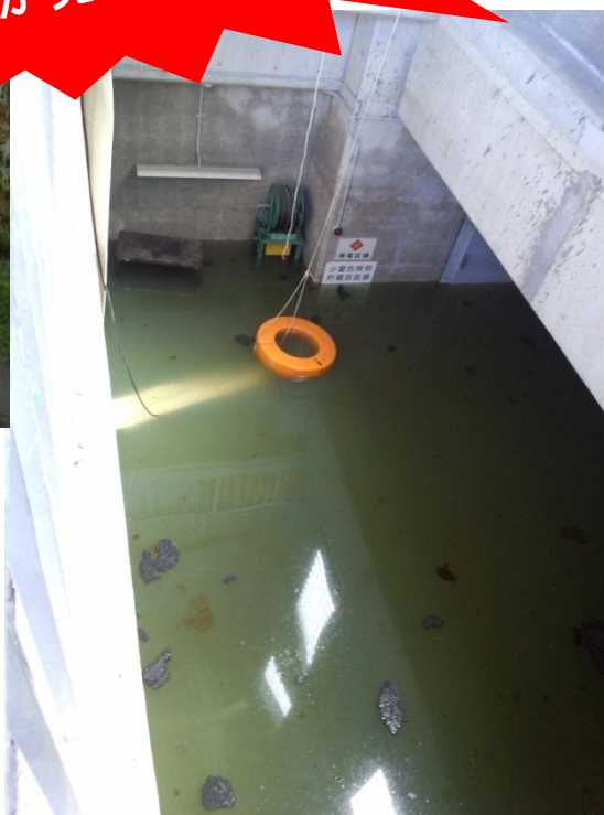
水没したポンプ場

平成25年9月、台風18号の影響で大量の雨水が下水管に流れ込んだため、処理ができず、マンホールから汚水があふれ出ました。