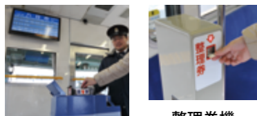
運賃表示パネルと運賃箱、整理券機