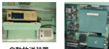
自動放送装置、運転士異常時列車停止装置