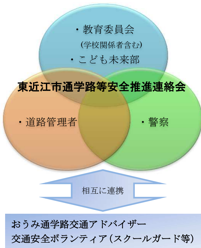
表1：「東近江市通学路安全推進連絡会」構成員

合同点検をはじめ、今日までの通学路の安全確保における取組の充実、強化に向けて関係機関の連携をさらに図るため、東近江市通学路等安全推進連絡会を開催します。