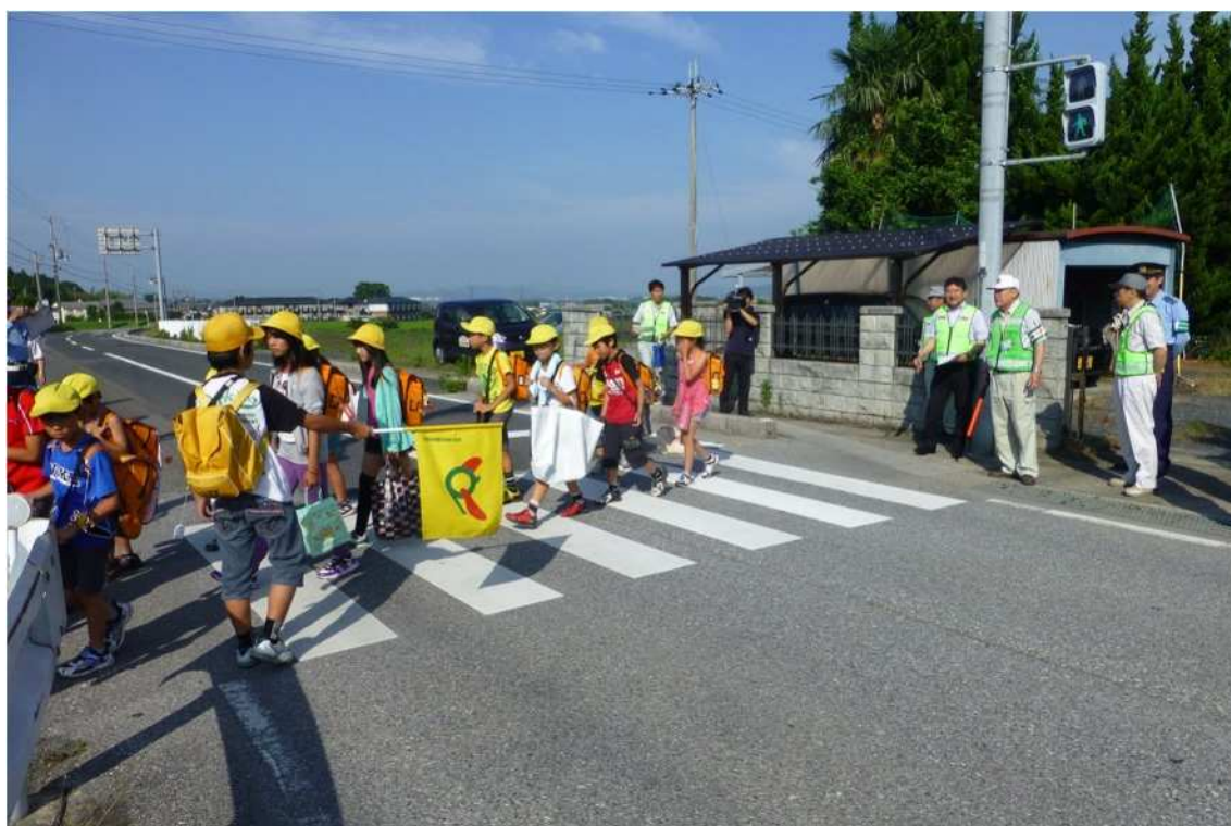
警察、道路管理者、学校、教育委員会等による通学路合同点検の様子

今後は、本プログラムに基づき、関係機関が緊密に連携し、通学路と園外活動経路における効果的な安全対策の検討・実施を通して、児童・生徒の登下校時及び未就学児の園外活動時における安全確保に取り組んでいきます。