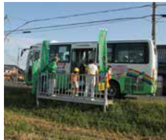
▲昨年度の最優秀作品

交通政策課メールアドレス kotsu@city.higashiomori-shiga.jp