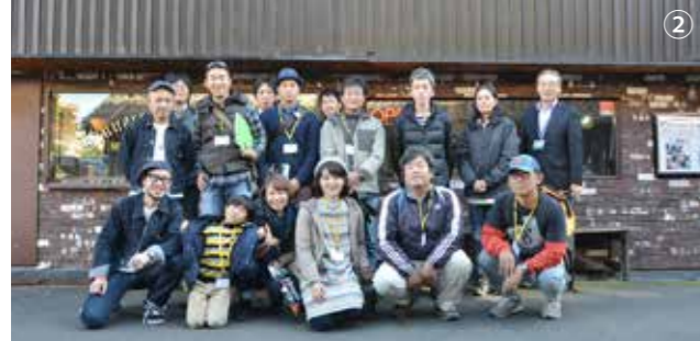
①ジーンズ工房で、小中さんの話に聞き入る ②カフェや靴工房の開業など、それぞれの思いを持ってツアーに参加!