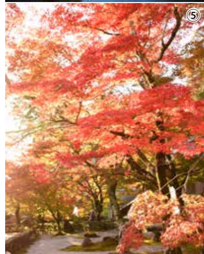
①山門前 ②秘仏が開帳された方丈 ③緑、黄、赤の色彩が鮮やか ④旦度橋から愛知川を望む ⑤境内の庭園も赤に染まる