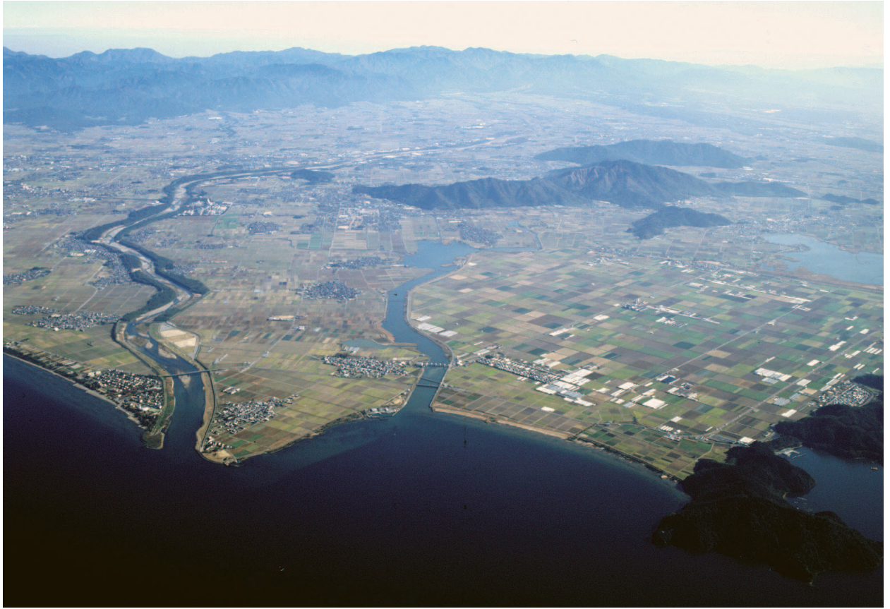
琵琶湖上空から臨む東近江市