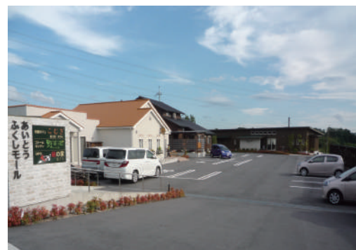
あいとうふくしモール