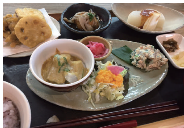
地元産野菜たっぷりの「野菜花ランチ」

モール内には「食」・「エネルギー」・「ケア」の自給をコンセプトに、それぞれの目的を持った3つの事業所（障害者の働きを支援する「NPO法人 あいとう和楽」、高齢者の暮らしを支援する「NPO法人 結の家」、食を通じて地域循環を目指す「株式会社あいとうふるさと工房」）があり、互いの事業活動を連携させ、さらに地域とのかかわりを持つことで、安心と生きがいのある暮らしを創造する地域拠点を目指しています。