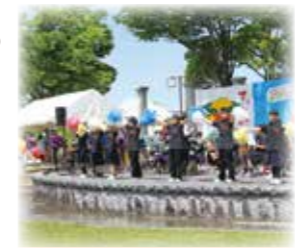
▲五個荘中学校吹奏楽部

◆ステージイベント ①五個荘中学校吹奏楽部の演奏 ②Dance studio KAERU によるショー ③商工戦隊赤レンジャイ&ゆるキャラによるショー ④キッズチア【PIECE】によるチアダンス ⑤滋賀学園チアリーディング部による演技 ⑥ジャンボ抽選会 ◆出店など ◆新鮮野菜朝市 ◆各種団体・事業所による模擬店・物産販売など ◆フリーマーケット ◆冒険遊び場「はらっパーク」など 問 五個荘コミュニティセンター ☎0748-48-2737 IP 050-5801-2737 FAX 0748-48-6454