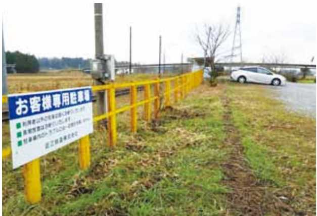
パーク＆ライドで利便性向上と乗降客数増

A ①市内にある13駅全てに自転車駐車を設置し、利用台数によっては増設を行っています。また、子どもの頃から電車で親しんでもらうことを目的に、ヘッドマークデザインの募集事業などを十数年来行っています。②利用者の利便性の向上を図り、乗降客数の増加につながる方策として有効な施策の一つであると認識しており、今後検討を進めていきます。③主要駅における駅前公共スペースの整備など、当市独自の支