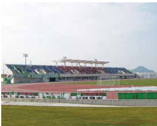
ネーミングライツ(命名権)の可能性は