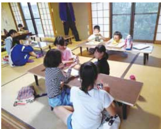
新たな交流の場となっている子ども食堂