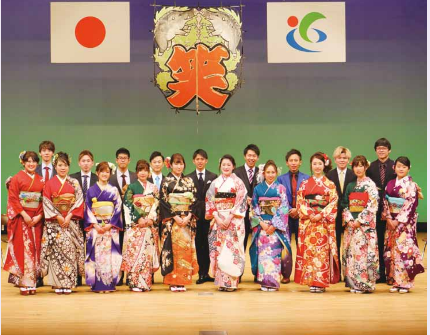
東近江市成人式実行員会の皆さん