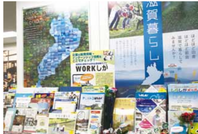
都市部でもっと東近江の魅力発信を

Q 体験交流型旅行は、将来の移住者呼び込みきっかけづくりにもなる大変意義のある事業だが、推進体制を「東近江市体験交流型旅行協議会」から民間主導の「ただいまステイ東近江」へ再編する計画が進んでいる。