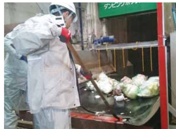
分別を確認する作業

Q 31年4月から愛東・湖東地区の可燃ごみなどの搬入先が、湖東広域衛生管理組合から中部清掃組合に変更されるが、