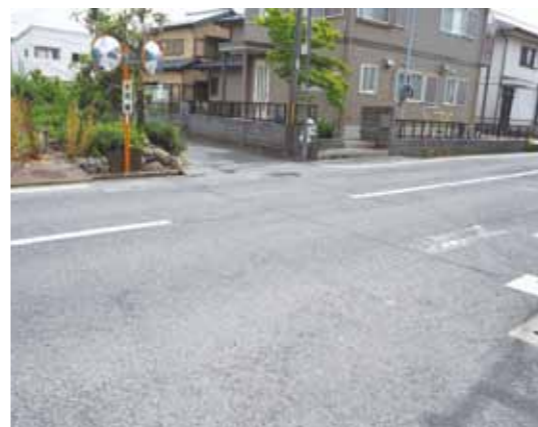
摩耗が激しく確認しづらい横断歩道