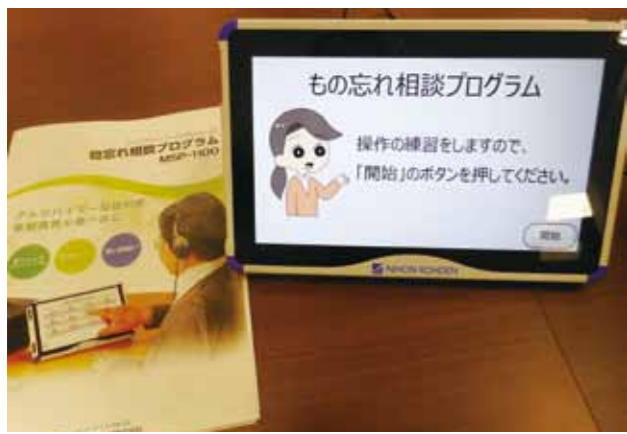
タッチパネルを活用したものわすれ相談室

A 75歳の誕生日の前月に後期高齢者医療制度の説明会を案内し、参加者には面接を行い、欠席の方には、基本チェックリストを配布し、フレイルと思われる方には短期集中介護予防教室への参加を促しています。