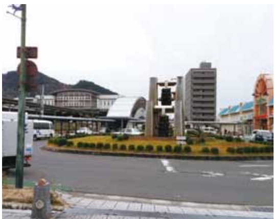
観光バスが通行できるよう改善を

Q 能登川駅周辺整備について、 ①駅西広場を観光バスが通行できるように改善しては。また、駅東側の早期整備は。