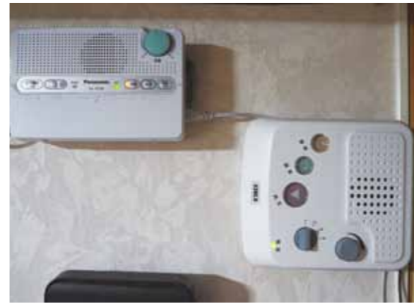
全戸に配布中の防災告知端末 (左)

Q 29年度末の設置状況は52%なので、年8ポイントしか増えないことになる。これでは市の当面の目標80%達成まで2年半以上かかることになる。