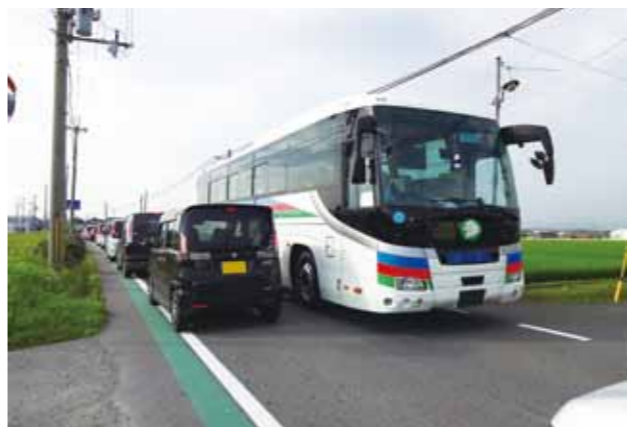
歩道設置が必要では？