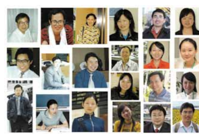
21人の常德市行政研修生

Q 友好都市である中国常德市は人口600万人。中国経済は安定期に入ったとはいえ、経済成長は著しく、消費はまだまだ活発である。 両市の24年にわたる友好の歴史は重要で信頼感にあふれている。特にこの間21人も常德市政府職員が研修生として当市に勤務されている。 今後は、文化交流の時代から経済交流の時代に変革し、互いにウィンウィンの関係を築く必要がある。当市の52倍の人口を有する常德市との経済交流は魅力である。 市内の経済・農業団体と協力し、常德市との新たな友好関係を構築する考えは。また、友好25周年の節目となる31年度が好機と考えるが。 A 11月10日から市長を団長とする使節団が常德市を訪問し、共産党常德市委員会周書記らに市人民政府曹市長と、経済や観光の交流を活発化させること