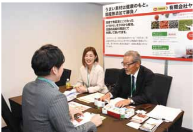
好評だった事業承継個別相談会