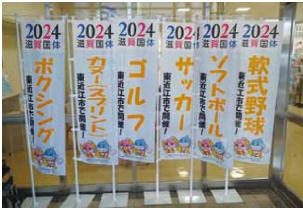
市内では6競技が予定されている

A 2024年に当県で開催が予定されている国民スポーツ大会について、前回開催から40数年が経過していることから、当