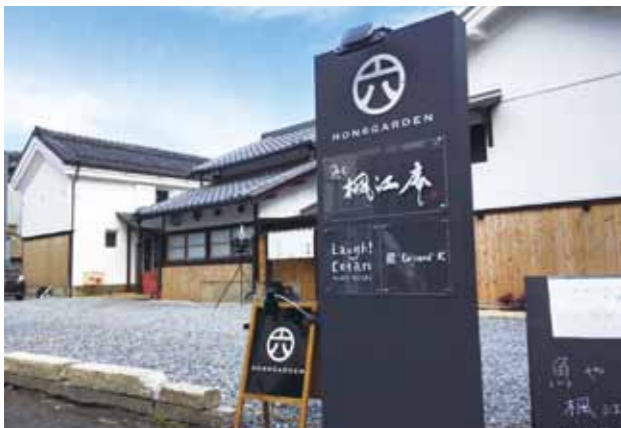
本町商店街にオープンした飲食店

Q 中心市街地の人口増加に向けた民間のアパート、マンションの活用について、 ①空き部屋数や状況を把握しているか。 ②企業支援課を窓口にした空き部屋対策に取り組むことで効率的に人口密度を上げられると考えるか。 ③民間事業者と連携し、空き部屋エリアを共有することは、中心市街地の人口増加に有効だと