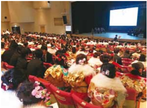
今年は多くの新成人が集まった記念式典

A ①成人となったことを祝い励まし、成人としての自覚を促すことを目的として市が実施しています。②28年に大きく減少したことから、29年からは式典イベントに