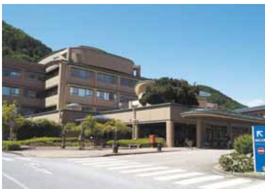
利用者、医師も増え 経営改善された能登川病院

Q 当市の医療施設について、 ①各診療所の現状は。 ②指定管理者制度移行後の能登川病院の現状と評価は。 A ①永源寺およびあいとう診療所は、それぞれ指定管理者制度を導入し、利用料金制により独立採算制を原則とする運営です。建物の維持管理や医療機器などの更新は市の責任で行っています。湖東診療所と蒲生医療センターは市が運営しています。が、どちらも赤字が続いています。 ②平成27年度の指定管理者制度移行後、外来患者数、入院患者数、ともに増加しています。さらに、本年4月から眼科に特化した診療も開設され、眼科の受診者数も増えていきます。懸念されていた医師も大幅な増員となっています。地域に根ざした健全で前向きな経営をされており、今後も継続できるような環境整備に努めていきます。