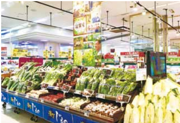
地元野菜が並ぶ大型スーパー

A ① 30年度の実績において後半6カ月で全体の8割を売り上げていること、また販路については引き続き17社との取引と拡大が見込めること、さらに損益分岐点を考慮して本年度の売上目標が定められました。 ② 主な経費は、人件費・運賃・容器包装費・冷蔵庫や運送トラックなどの賃借料で、前年度4670万円が支出されています。本年度は6千万円を見込んでいます。