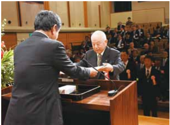
功労者表彰は市政施行日に

A ① 郷土を知る教育は、教育振興基本計画「教育三方よしプラン」に位置づけ、ふるさとを愛する教育を推進しています。小学校の社会科では、副読本、郷土学習資料集「わたしたちの東近江市」を作成し、主に3、4年生で活用しています。副読本では、鈴鹿山脈から琵琶湖に