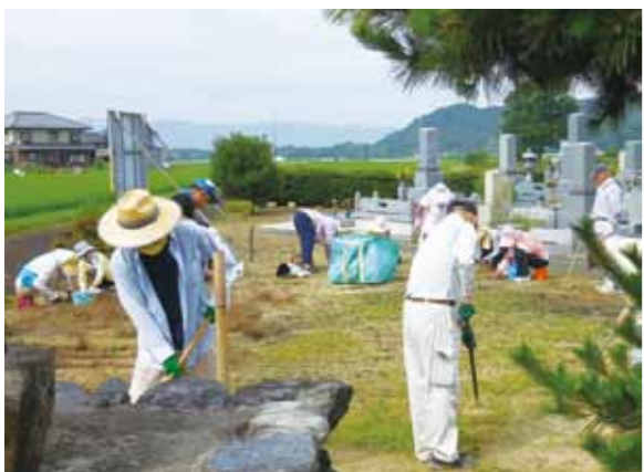
単位老人クラブでの奉仕作業

A ① 単位老人クラブは高齢者のもつ豊かな経験と知識を生かして、地域の防災・防犯・交通安全活動や独居高齢者などの訪問、花植え、清掃活動など、高齢者の社会参加活動や生きがいづくりによって、自らの生活を豊かにするとともに、まちづくりの一翼を担っていただいている高齢者の団体と位置づけています。その活動は、活力がある住みよい地域づくりにつながっていると評価しています。 ② 老人クラブへの支援は、明るい長寿社会の実現と保健福祉の向上にもつながる高齢者の活動に対する支援の一つであり、本年度は連合会への加入が大きく