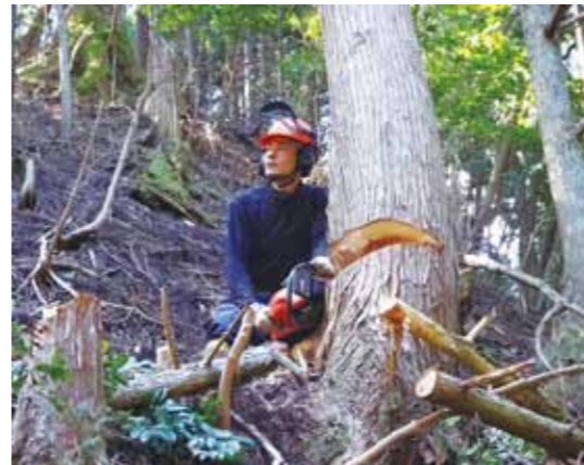
求められる林業従事者

A 森林環境譲与税の県試算では、本年度から3年間は約1千万円が交付され、その後段階的に増加し、10年後以降は毎年約3千万円の交付となる見込みです。譲与税については、専門的な技術や知識を有する森林管理アドバイザーの雇用をはじめ、