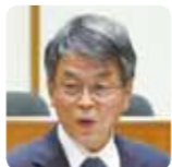
日本共産党議員団

③ 固定経費と変動経費を精査し、2億6千万円程度です。 ④ 水田における野菜の生産を推進するため、生産拡大分について1年目10アール当たり8万円を助成する補助事業を本年度創設しました。 現在、JAと協力しながら事業推進に向け、各農家への周知を行っています。