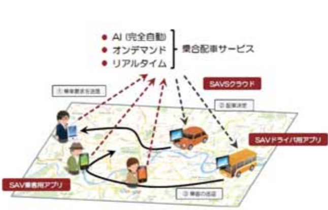
ICTを活用した相乗り運行のイメージ

現在、相乗り・ライドシェアアプリを利用したサービスシステムがあるが、これを適法の範囲内で一般タクシーやちよこつとタクシーに導入し、自動車を運転できない高齢者や子ども、障害を持つ人、運転免許を持たない、持てない移動制約者などにも十分な安全性と利便性を兼ね備えた地域公共交通システムを確立すべきである。 二、三にズレのある地域から、