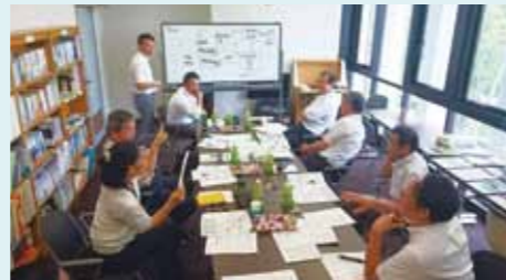
議会だより編集委員会

議会の日程など議会の運営に関することは、議会運営委員会で決定しています。また、特別な事項を専門的に調査するため、特別委員会を設置しています。現在、河川整備推進特別委員会があります。このほか、議会改革検討委員会や議会だより編集委員会、議会報告会運営委員会があります。