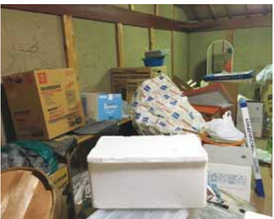
元気なうちにモノの処分を

Q 60歳以下でフルタイムで働く市の嘱託・臨時雇用の専門職員は年収200万円前後であるが、① その人数と平均勤務年数は。② 市は長く勤めてもらいたいと考えているのか。③ 現在、幼保で50人以上の求人が出ているほか、発達支援セン