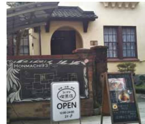
地域で活躍し続ける協力隊員

Q 地域おこし協力隊について、①協力隊員の評価はどのようにしているか。 A ①毎月の会議で報告を受け、指導や助言を行っています。②地域の課題解決のために住民と協力隊員と一緒に問題を整理し解決すべく事業に取り組みることが重要であり、地域が持つ力を再確認し評価することが大切と考えます。