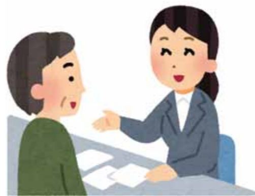
困ったときはすぐ相談を

です。減免制度は6月の納税通知のときにお知らせしています。 ② 分納は182件。納税猶予と換価の猶予の申請はありません。 ③ 制度の案内はしていますが、申請はされませんでした。代替として分納誓約に応じています。 ④ 差し押さえはしていません。 ⑤ 何度催促しても応じてもらえないときにはやむを得ず差し押さえしています。相談に来られれば解除などの対応をしています。