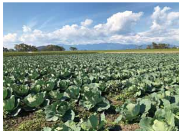
農家との連携を密に

主な要因の1つ目は、野菜の出荷体制についてはJAを通じて必要量を農家に依頼することとしていましたが、このことが徹底できていなかったため予定以上の出荷があり、売れ残りが発生し、廃棄処分にも多額の経費が必要となったことです。 2つ目は、買取価格は市場価格の過去3年間の平均を目標として取引を開始しましたが、昨年の秋から全国的な豊作で価格の低迷が続く、計画どおりの利益が確保できなかったことが赤字の要因と考えています。