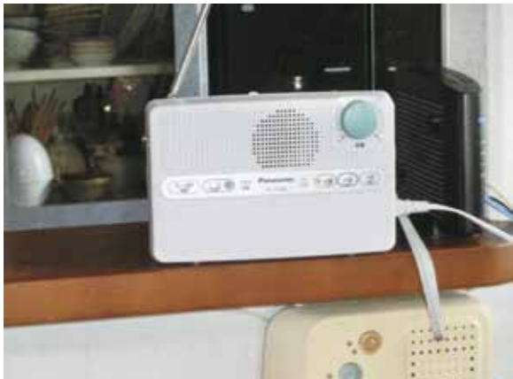
録音機能でいつでも聞ける

Q 防災情報告知放送システムを学校などから保護者や住民への連絡手段に使い、戸別受信機設置促進につなげられないか。 A 連絡手段として利活用を検討し、設置促進につなげます。