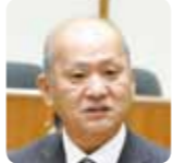
日本共産党議員団