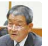
日本共産党議員団

そこで、冷たい水がいつでも飲める冷水機を設置する考えは。 A 小中学校での飲料水は、水筒を持参するように指導しており、特に夏場においては量を増やすなどの対応を各家庭にお願いしていることから、冷水機の設置は考えていません。 今後の気象の変化について引き続き注視し、施設整備を含めた取り組みが必要となれば対応していきたいと考えています。