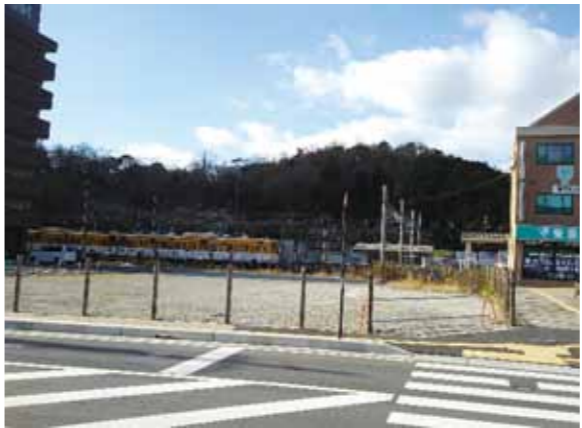
八日市駅前の未利用地

③ 昨年度は民間事業者の関心度を測るための調査と測量設計業務を実施しました。本年度は官民連携支援業務を発注し、民間事業者の募集条件やリスク分担を整理し、その後、施設整備の提案を民間事業者から募集、選定し、本年度末までにパートナー協定を締結したいと考えています。