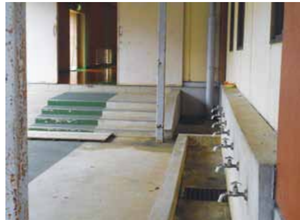
冷水機設置が望まれる学校施設

Q 児童・生徒の小中学校での水分補給として各自が水筒を持参している。 環境省の熱中症環境保健マニュアルでは、「飲料は5℃から15℃で吸収が良く、冷却効果も大きい」とあるが、当市の水道水の6月から9月の平均水温は20℃を超えている。