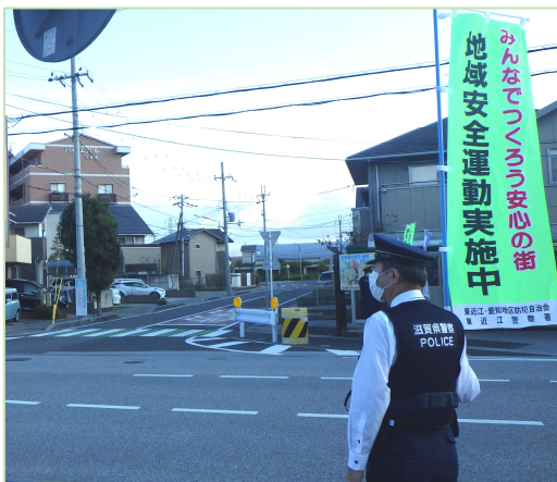
愛知川消防センター前交差点 (10/13) ▲▶

全国地域安全運動期間中の10月13日(火)と10月16日(金)に愛知川消防センター前交差点で、10月20日(火)に東近江警察署前と西友前の交差点で、東近江警察署員とともに、のぼり旗を持って同運動の周知と犯罪の被害防止を呼びかけました。