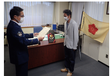
▲ 秦荘東小学校PTA 様