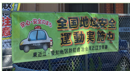
▲西友前交差点に掲出した横断幕