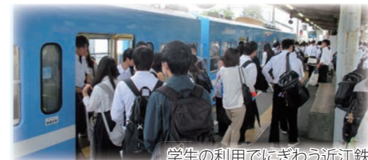
学生の利用でにぎわう近江鉄道