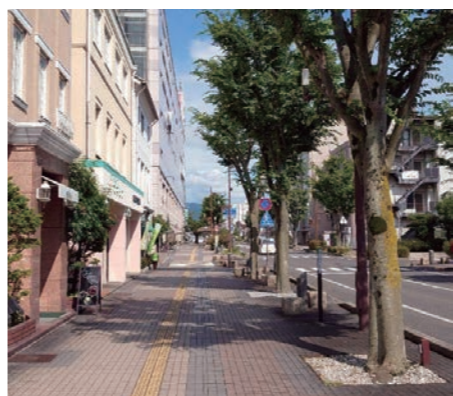
開放感のある屋外で秋の気配を感じながら、ちょっとひと息。

■開催場所 近江鉄道八日市駅前から浜野町交差点までの歩道上 ■主催 八日市駅前えいとてらす実行委員会(東近江市、株式会社平和堂アル・プラザ八日市、八日市商業