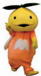
こどもみらいちゃん

「認定こども園 (教育標準時間認定)・幼稚園」と「認定こども園 (保育認定)・保育所・地域型保育」の併用申請はできませんので注意してください。