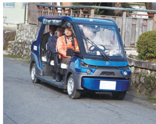
運用の可能性が高まる自動運転車

消やダイヤの充実につながり、将来の市内交通網を維持確保していくための方法として有効であると考えています。③市内他地域への導入については、技術が発展途上であり法整備も必要なことから、まだまだ時間を要すると考えます。将来的には生活拠点から最寄りのバス停などを結ぶラストワンマイル(最後のひと区間)を対象とした展開を研究していきたいと考えています。