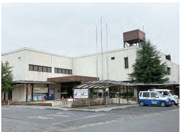
老朽化が進む湖東コミュニティセンター

A 築後40年が経過しており、近年、ホール天井の改修をはじめ、必要な修繕で施設の長寿命化を図り継続使用しています。旧湖東保健センターについては、現在、基幹統計調査作業スペースとして活用しています。今後は、地域からの要望も踏まえ、施設の整備や活用について検討していきたいと考えています。