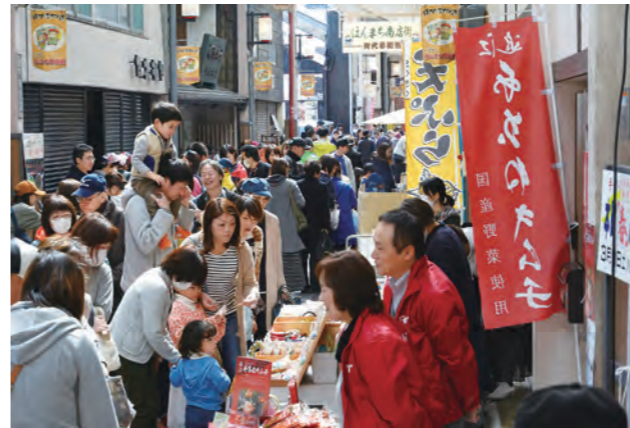
本町パサージュの様子(2019年)

A ①観光客をはじめ交流人口が増加したことや中心市街地への出店の増加など、にぎわい創出については一定の効果があつたと考えています。一方で、さまざまな施策にチャレンジしていますが、若い世代の転出は続いており、合計特殊出生率の低下、農業や中小企業などにおける担い手や人材の不足といった課題の解決には、現時点では道半ばであると認識しています。②4つの政策の柱に1つずつ代表指数として数値目標を設定しています。その達成は、働き住み続けたい活力のある東近江市の創生の数値目標「市内事業所従業員数」5万人に対し4万8443人、行きたくなる住みたくなる魅力ある東近江市の創生の数値目標「観光入込客数」年