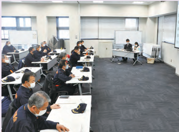
担当部から説明を受ける

1月19日に、東近江市議会業務継続計画（BCP）に基づく災害時感染症対策研修を実施しました。