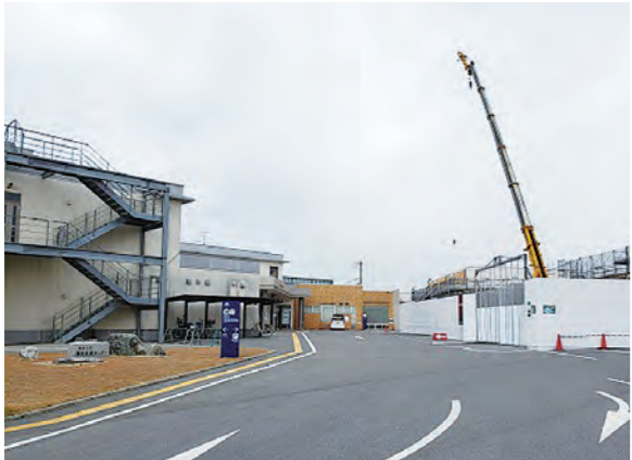
工事が進むがん診療棟

指定管理移行当初は、心配の声や不安を抱かれることもありましたが、指定管理者の努力もあり、これまで以上に愛される医療機関として実績を積んでおられます。