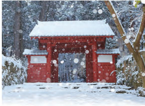
百濟寺の赤門（市指定文化財）

今後の展望としては、現在の観光入込客数約70万人を100万人に伸ばすことで、周辺の百濟寺や永源寺などへ観光客を呼び込み、さらなるにぎわいをつくり出す原動力にしていきたいと考えています。 ②東近江地域には100を超え、聖徳太子ゆかりの寺社仏閣、史跡があり、全国的に見ても希少な地域です。この歴史的優位