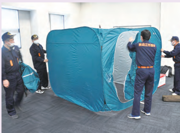
パーティションの組立訓練

まず、健康推進課から日頃の備えについて説明を受けました。家庭用漂白剤を500倍程度に希釈することで消毒剤として使用できることは恥ずかしながら知りませんでした。次に、防災危機管理課から避難所での距離の取り方などの説明を受け、その後4班に分かれ、実際にパーティションや簡易ベッドの組み立ての体験をし、避難所生活を実感しまし