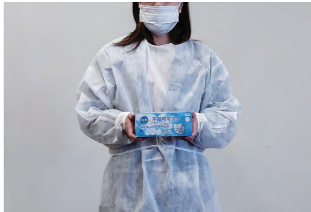
市内で製造されているマスクと医療用ガウン

A ①品不足は世界経済が動き出したことにより徐々に解消されました。市内においてはマスクやフェイスガードなど、市内業者の連携で生産・販売できるようにになりました。