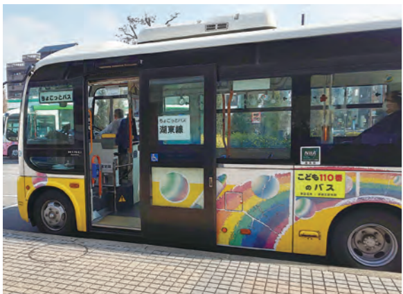
ICカードが導入されるちょこっとバス

②地域のまちづくりをはじめ商業振興や公共交通の利便性向上、また各個人への生活支援や地域住民による助け合いの仕組みづくりなどさまざまな視点から検討が必要であり、部局連携しな