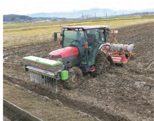
高齢化が進む集落営農

A ①一貫して攻めの姿勢でまちづくりを進め、市民生活第一に市政運営に当たり、観光施策による知名度向上にぎわいを創出し、中心市街地活性化、企業誘致により新たな人の流れをつくることができました。また、子育て、教育、健康、福祉、医