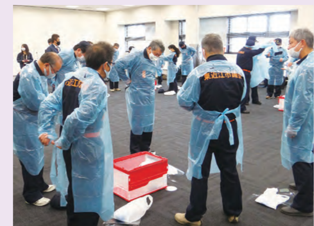
医療用ガウンなどの着脱訓練

市議会では大規模な災害の発生時においても、議決機関・住民代表機関として迅速に意思決定できる機能維持を図るため、必要な組織体制や議員の行動基準などを定めた東近江市議会業務継続計画（BCP）を策定しています。そのBCPをブラッシュアップすべく、毎年この時期に災害時の行動に関する研修および訓練を行っています。