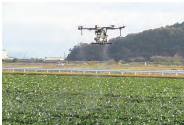
ドローンによる防除

Q 米の消費量が減り続ける中、高齢化などで農家が減っているが、集落営農法人は多く設立されている。本市には115の法人があるが、麦・大豆の農地の高度利用から高収益作物の作付けへの転換、さらに、年間を通