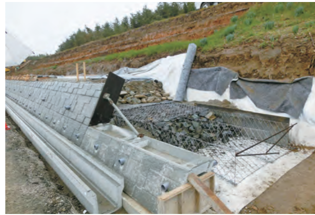
強化工事が進む愛知川堤防

A 堤防強化対策は平成26年度から阿弥陀堂町の下流部で工事が進められ、今年度の施工区域を含めた約1500mの整備が