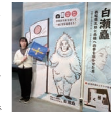
▲記念撮影ができます。

〒050-5802-2291 ☎0749-45-3556 ■白瀬蘆生誕160年記念ミニ企画展 「白瀬蘆 西堀榮三郎に南極への夢を抱かせた男」 白瀬蘆は日本人として初めて南極を探検し、西堀榮三郎に影響を与えた人物です。 時 5月23日(日)まで ¥ 大人300円、小中学生150円 ※市民は無料 休館毎週月・火曜日