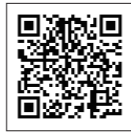
しがネット受付サービス