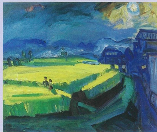
登校の図(昭和15年頃、現・蒲生東小学校に寄贈された作品)