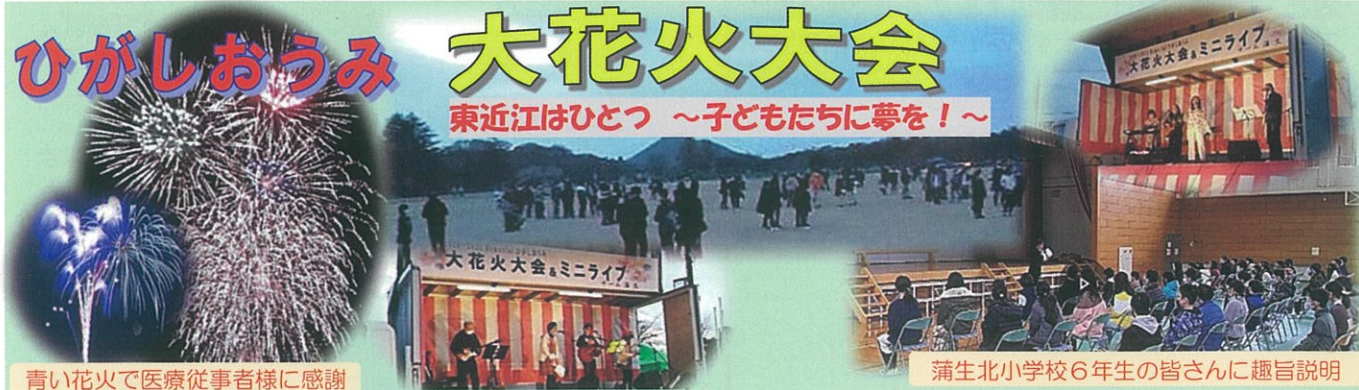
青い花火で医療従事者様に感謝