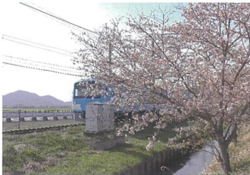
蒲生地区まちづくり協議会（広報企画委員会）

おしゃれな駅看板に惹かれて桜川駅から八日市方面行きの電車に乗車。出発してすぐ、前方右側に桜並木が出現。京セラ前駅手前まで続く。アマチュアカメラマンもちらほら。そうか、電車内からではなく、桜の中を走る電車を撮るんや。