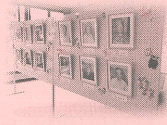
令和2年度掲額の様子