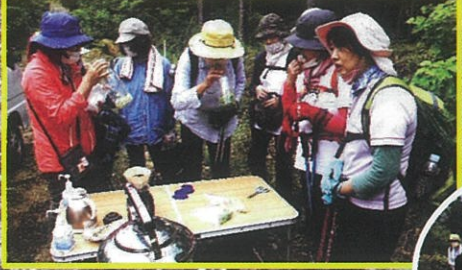
コーヒー&ハーブティで女子タイム(^_^)も楽しみました