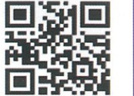
クイズの応募はQRで簡単!

☆当選され5名の方に、「角井すいか」をプレゼント!今回は、あいとうまつり実行委員会から「夏の大プレゼント(角井すいか)」です。その他ご応募いただいた方に粗品を進呈させていただきます。当選者の発表は、プレゼントの発送をもってかえさせていただきます。 ☆6月号には16名の皆様からご応募いただきました。ありがとうございました。