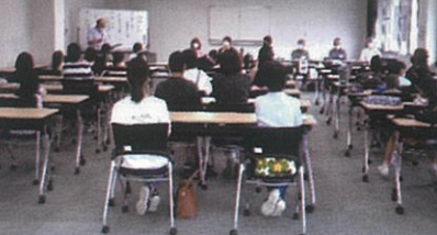
第1回開講式の様子

また、学習だけでなく、様々な体験活動にチャレンジし、「生きる力」も育ててほしいと考えます。楽しみにしてください！