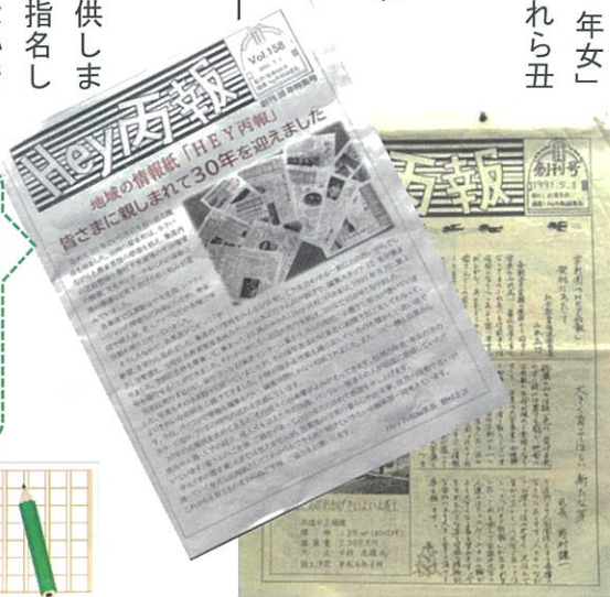
親しまれて30年の 手作り情報誌

とはいえ、いままで30年のご苦労をねぎらうとともに、今後若いスタッフも加入され、40年50年と『Hey丙報』の歴史が受け継がれていくことを、お祈りいたします。