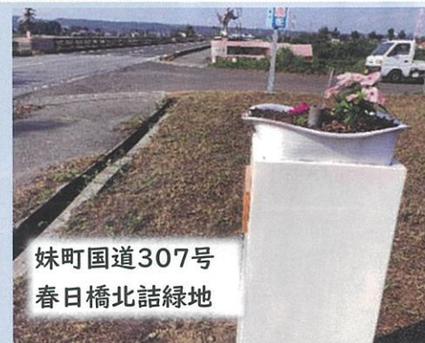
妹町国道307号 春日橋北詰緑地