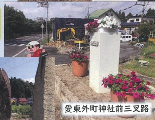
愛東外町神社前三叉路