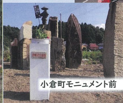
小倉町モニュメント前