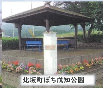
北坂町ぼち戊知公園