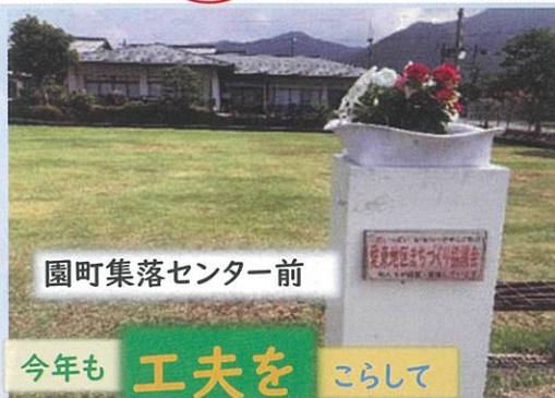
園町集落センター前