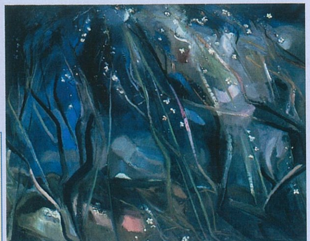
白梅 100号 蒲生地区まちづくり協議会 (万葉ロマンの里づくり部会)

(なお出展予定作品は、3月26日に白梅 100号 雪後 50号 草千里 60号 朝日 50号 夕月 30号 秋 30号 畔木の秋 30号が延着し、うち5点が架け替えられています。)