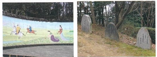
蒲生地区まちづくり協議会(広報企画委員会)

歴史上あまりにも有名な、 ぬかたのおおきみ 額田王と おおあまのみこ 大海人皇子の相聞歌が誕生したと言われる蒲生野を彷彿とさせる。小高い船岡山の山頂付近にはその歌碑もあり、「蒲生野万葉短歌会」での歴代の大賞作品も立ち並ぶ。ここは万葉の風情が漂う。