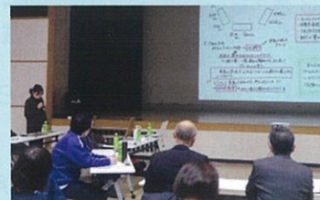
【蒲生地区まちづくり協議会・蒲生地区地域教育協議会】