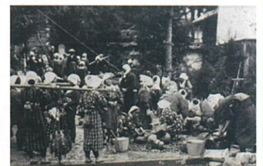
石塔寺での作業風景

当時の新聞記事には「男の掘ったものを女が水で綺麗に洗い」と作業現場を紹介し、「境内には石像並に五輪塔の石材が山のように並べられ、見物に押しよせる善男善女で非常な賑いを呈し」と記されている。「石仏集座之記録」には、集まった人に炊き出しをしたとある。当時の写真からは、大八車で石仏を運ぶ人、石仏を畚(もっこ)に載せ棒で担ぐ人の様子などを窺うことができる。