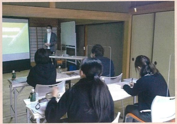
【(一社)がもう夢工房】