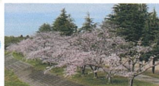
日野川沿い (蒲生運動公園周辺)

蒲生地区には、日野川、佐久良川の川沿いや近江鉄道沿線等に、桜並木がたくさんあります。暖かい春の日、ぜひ見つけて楽しんで下さい。