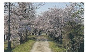
佐久良川沿い (蒲生体育館周辺)