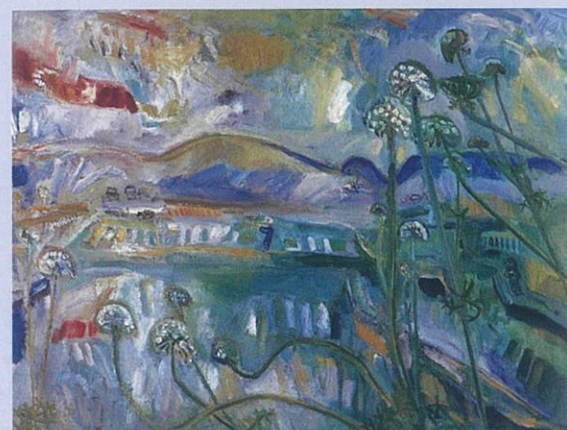
「朝」50号 昭和18(1943)年 新文展審査員として特別出展 その年の7月に描き上げた秀逸な作品 蒲生地区まちづくり協議会(万葉ロマンの里づくり部会)