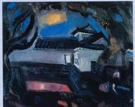
彦根城 30号 制作年 日記から昭和13年9月の作?