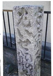
蒲生地区まちづくり協議会(広報企画委員会)