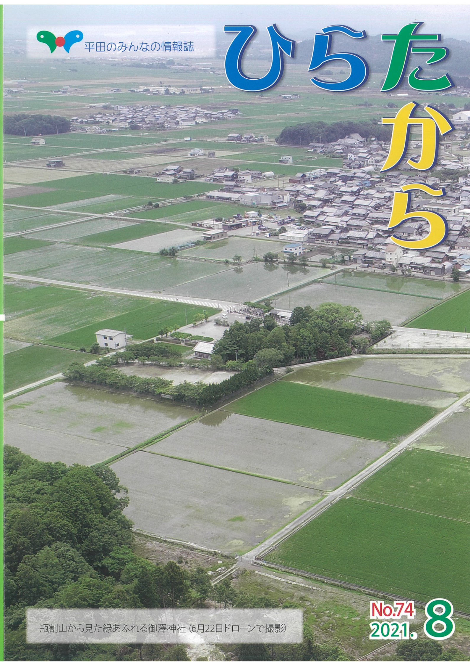
瓶割山から見た緑あふれる御澤神社(6月22日ドローンで撮影)