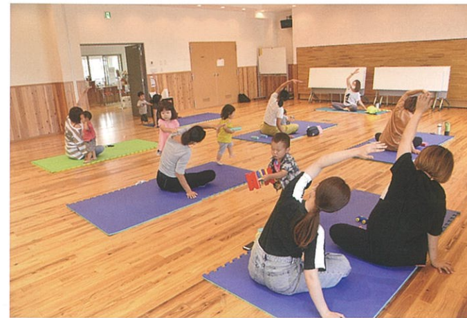
平田地区スポーツ協会

なかなか体を動かすことができないお母さんたちにとって少しリフレッシュできた時間になったのではないで