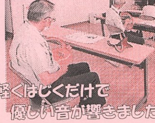
軽くはじくだけで 優しい音が響きました

11月には八日市文芸会館で体験会があります。 詳しくは東近江市観光協会発行の 『東近江ちいさなたびいち 2021』 をご覧ください。