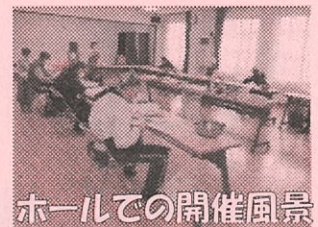
ホールでの開催風景