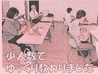
少人数で ゆっくり教わりました