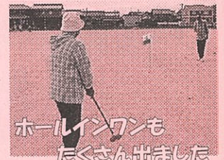
ホールインワンも たくさん出ました

開催にあたって、共催としてまち協健康福祉部・社会福祉協議会、そして準備・運営の協力 として市辺地区グラウンドゴルフ同好会役員の皆様にご尽力いただきました。 ありがとうございました。