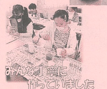
みんな丁寧に作っていました

5月8日(土)、『グラスサンドアートフラワー』に挑戦してもらいました。透明容器の中にカラフルな砂を層になるように重ね、一番上に花等の飾りをセットして完成！中には家族へのプレゼントにしようと一生懸命取り組んでいる姿も見られました。