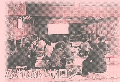
ふれあいサロンでの様子(布施)

市辺コミセンでは皆さんの町まで伺う“巡回シネマ”を実施しています。上映機材(プロジェクター・スクリーン・音響)はコミセンが準備します。