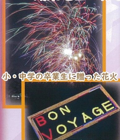
小・中学の卒業生に贈った花火