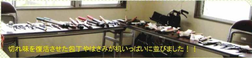
切れ味を復活させた包丁やはさみが机いっぱいになりました！！

※毎月第一金曜日 9:30～11:30 御園コミセンでお 預かりしていま す。 ※11月は第二金 曜日です。 詳しくはコミセン までお問い合わせ ください。