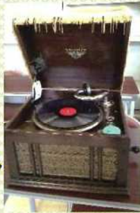
音色を響か せた蓄音機