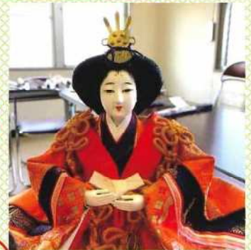
汚れたお顔がこんなに 綺麗になりました！