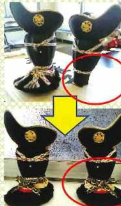
無くなった兜の足が復活！！