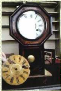
動き出した 音の時計

昨年度は、包丁やはさみの他に雛人形や蓄音機など珍しいお預かり物がありました。雛人形も蓄音機も見事によみがえりました！新しい命を吹き込んで、雛人形は3月3日に…蓄音機は懐かしい音色を聴かせてくれました。