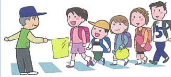
コデラさん前の縁石