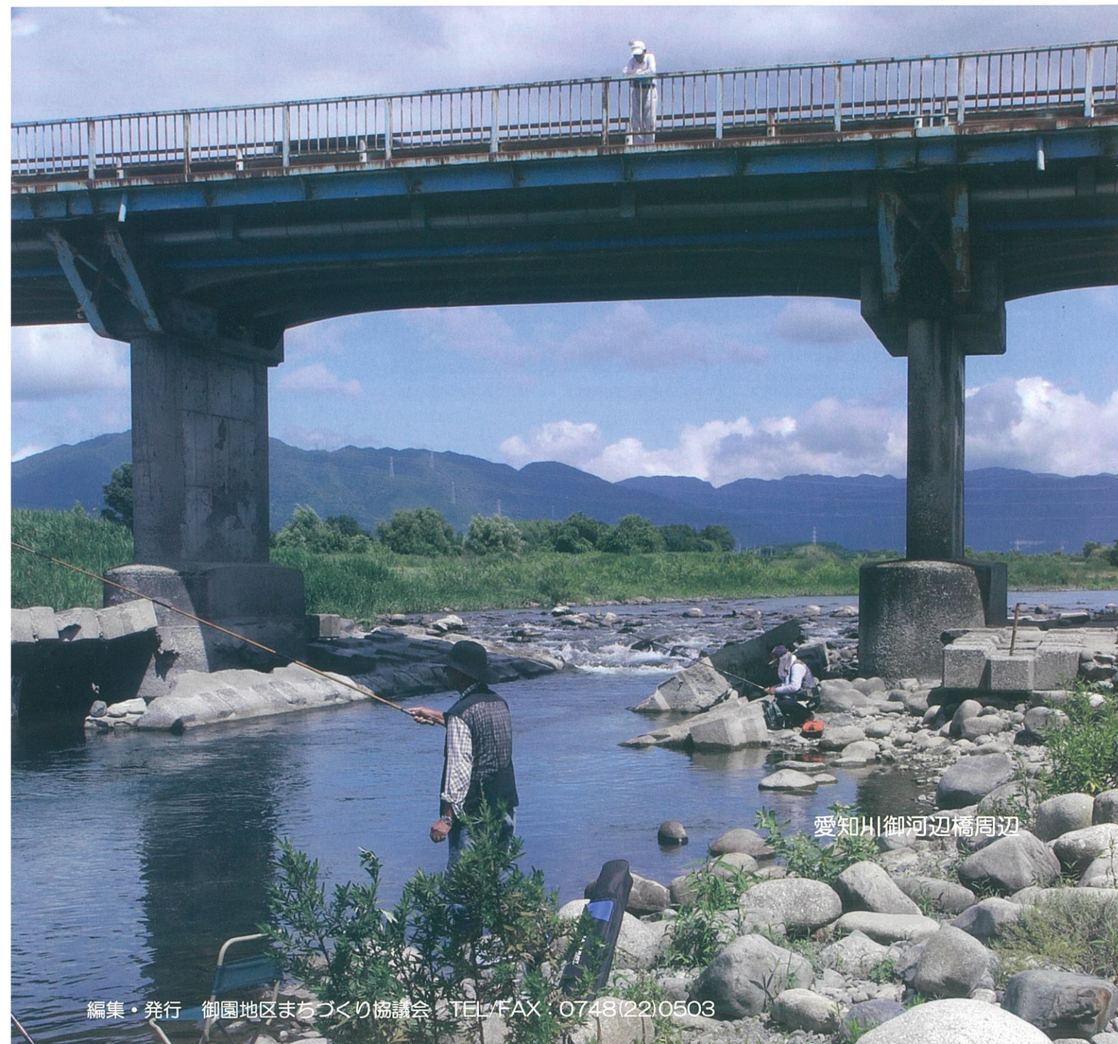
愛知川御河辺橋周辺