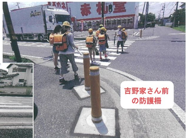
吉野家さん前の防護柵