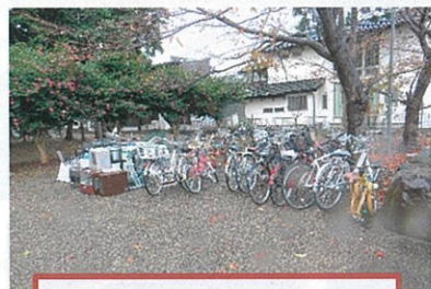
ひばり1・2・3・4自治会

11月27日(土)大型金属資源の回収が各自治会にて行われました。早朝より皆様のご協力ありがとうございました。役員の皆様ご苦労様でした。