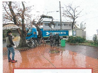
春日町・幸町自治会