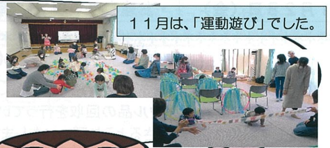
11月は、「運動遊び」でした。

12月は「クリスマス会」です。 きれいなクリスマスツリーを飾って、楽しみましょう！