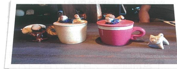
写真はイメージです。こんな感じかな!

第1回は、「陶芸教室」を行っています。今年、「ふた付きのコーヒーカップ」を作ってもらいます。ふたやカップに飾りをつけたり工夫したりして作ってもらえればと思います。学校を通して募集を行います。