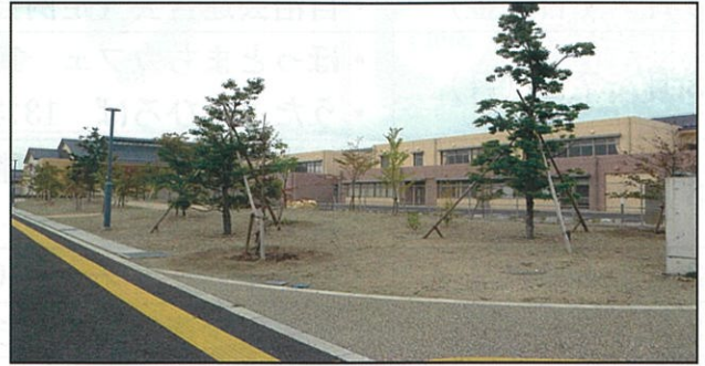
2012年 「子ども森」ができて1年半が過ぎたところです。

毎月の第2水曜日を定例の作業日として、樹木の根元や通学路・運動場の樹木の土壌改良を行っています。