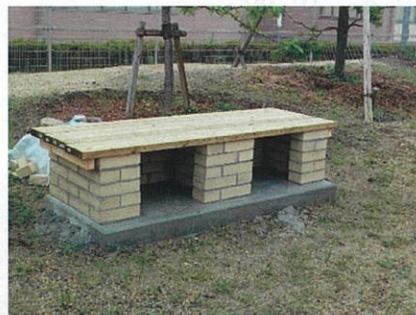
2013年 かまどベンチをつくりました。

さらに、そのような植生のみでなく、「子ども森」に作ったかまどベンチをつかって焼き芋大会を催したり、東屋を設置したりしています。