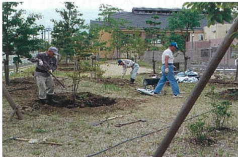
2013年、子ども森の整備作業です。