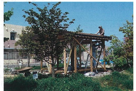
2018年 東屋を設置しました。