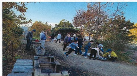
2021年 11月に、ひまわり幼稚園や学童の子どもたちと焼き芋をしました。

このごろでは、幼稚園の送り迎えの親子さんや、学童保育所の子どもらが「子ども森」で遊ぶ様子を見ることがあります。