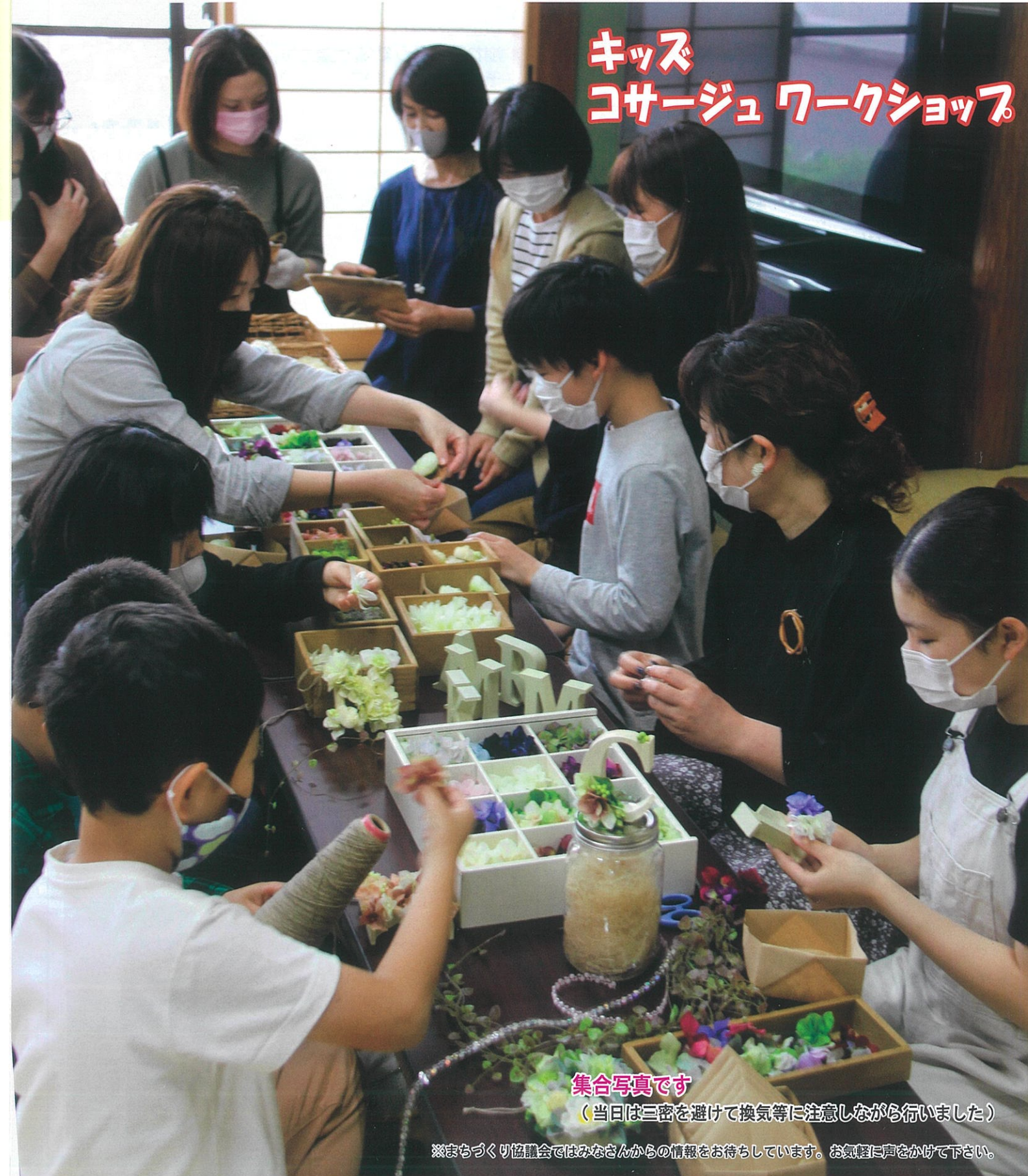
※まちづくり協議会ではみなさんからの情報をお待ちしています。お気軽に声をかけて下さい。