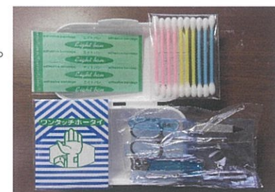
記念品の携帯用救急安全セット