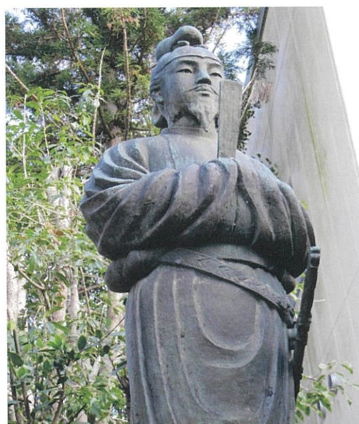
市神神社の聖徳太子像