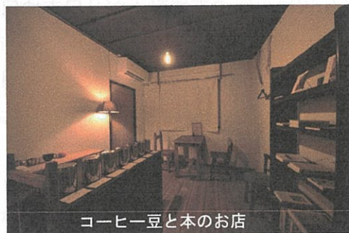
コーヒー豆と本のお店

建物自体は店舗やアトリエとして活用していきます。1階は飲食店、2階は店舗や事務所、3階はアトリエになり、借り手も集まりほぼ満室です。現在は1階には創作いなり寿司を出す「たか翔」というお店が営業しており、2階にはコーヒー豆と本のお店が営業しています。3階はアーティストが創作活動をしています。まだ改装中の部屋も多く、これからオープンするお店もあります。