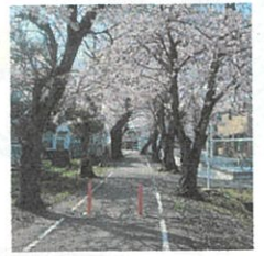
線路跡に植えられた桜並木

コミセンに展示されている「八日市ふるさと絵屏風」に描かれている湖南鉄道飛行場線は、沖野にあった飛行場に人や物資を運ぶため、新八日市駅から東本町の王将付近を經由し、札の辻まで走っていました。新八日市駅を出発すると八日市郵便局付近に八日市中野駅、王将の交差点付近に川合寺駅、終点の札の辻付近に御園駅（飛行場駅）がありました。現在、その廃線跡は国道421号と東本町の井田歯科東診療所横の自転車道路に姿を変えています。東本町総合自治会では毎年、春と秋に廃線跡の自転車道路の清掃作業を行い、周囲に植えられた桜並木の保全をされています。まち協では、健康増進や地域の歴史や魅力の再発見に「八日市ふるさと絵屏風」のウォーキングマップを検討中です。これから暖かくなったら、当時を偲んでウォーキングなどいかがですか？