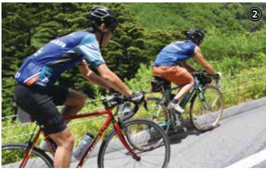
①能登川水車とカヌーランドから琵琶湖を目指して出発 ②奥永源寺の険しい坂も自転車で快走